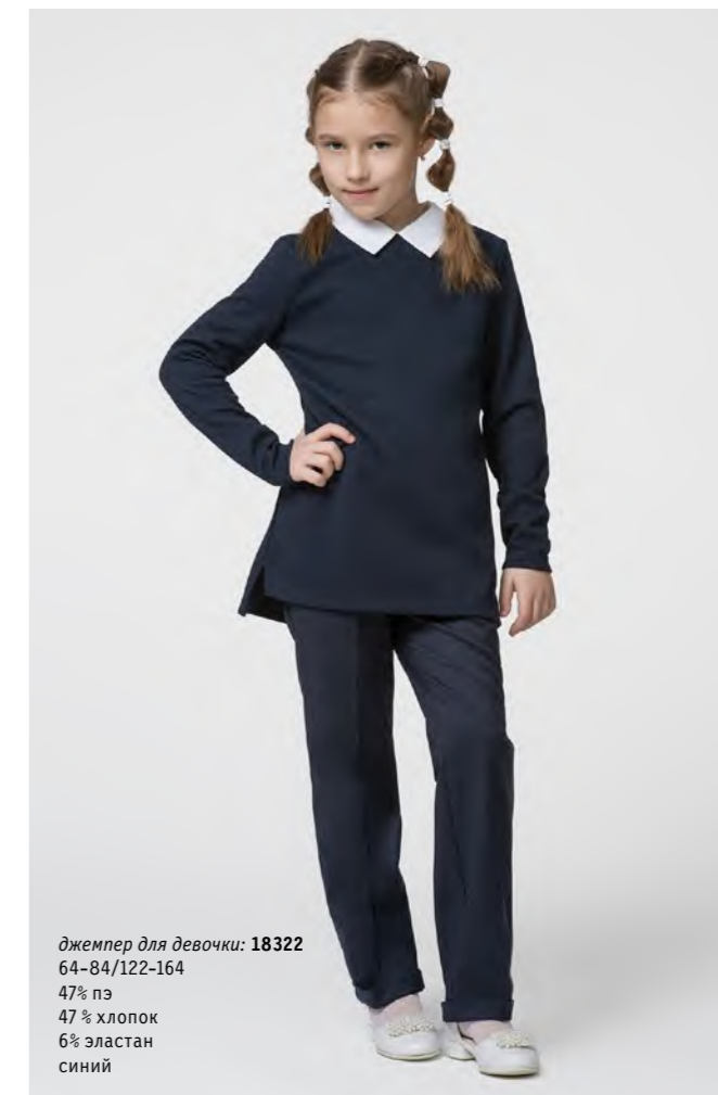
джерсер для девочки: 18322 64-84/122-164 47% пэ 47% хлопок 6% эластан синий