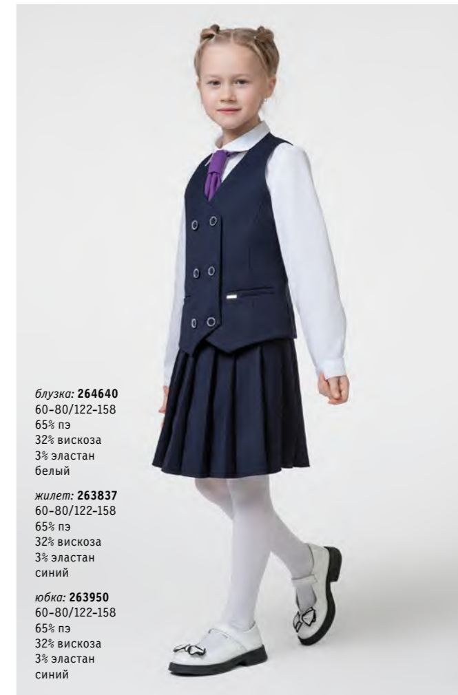
блузка: 264640 60-80/122-158 65% пэ 32% вискоза 3% эластан белый