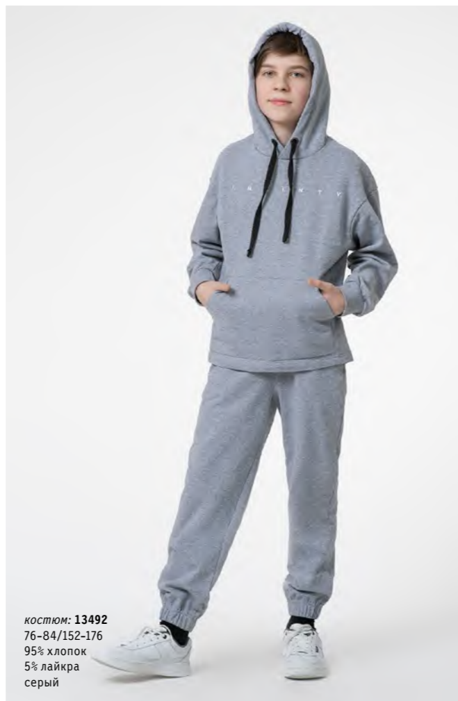
костюм: 13492 76-84/152-176 95% хлопок 5% лайкра серый