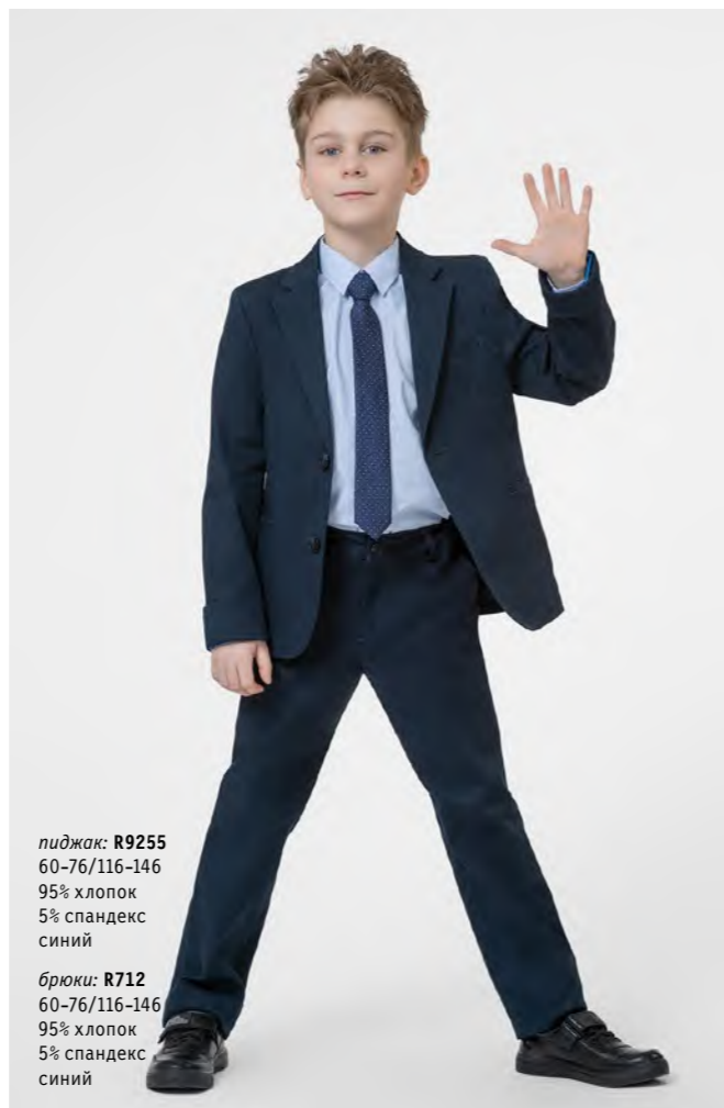
пиджак: R9255 60-76/116-146 95% хлопок 5% спандекс синий брюки: R712 60-76/116-146 95% хлопок 5% спандекс синий