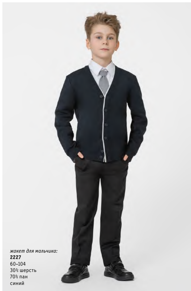
жакет для мальчика: 2227 60-104 30% шерсть 70% пан синий