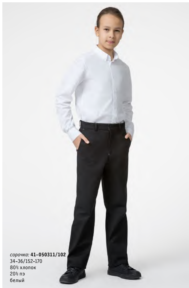
сорочка: 41-050311/102 34-36/152-170 80% хлопок 20% пэ белый