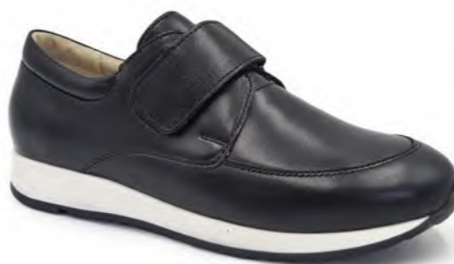
сандалии для первоклашек: 44592 170-200 натуральная кожа натуральная кожа тэп