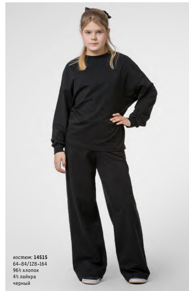
костюм: 14515 64-84/128-164 96% хлопок 4% лайкра черный