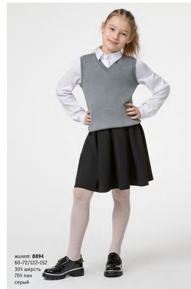
жилет: 8894 60-72/122-152 30% шерсть 70% пан серый