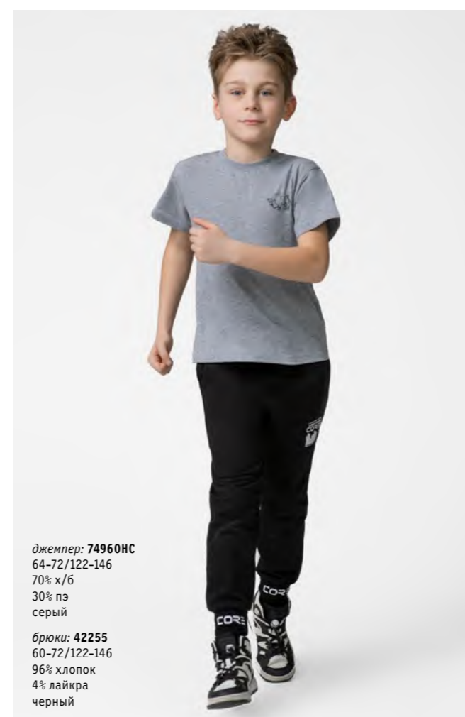
джемпер: 74960НС 64-72/122-146 70% х/б 30% пэ серый брюки: 42255 60-72/122-146 96% хлопок 4% лайкра черный

Будьте смелыми, уверенными и готовыми к новым вызовам в одежде от ОАО «Бобруйсктрикотаж».