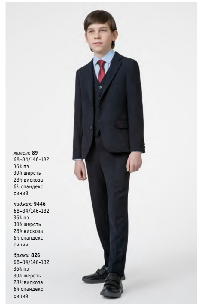
жилет: 89 68-84/146-182 36% пэ 30% шерсть 28% вискоза 6% спандекс синий пиджак: 9446 68-84/146-182 36% пэ 30% шерсть 28% вискоза 6% спандекс синий брюки: 826 68-84/146-182 36% пэ 30% шерсть 28% вискоза 6% спандекс синий