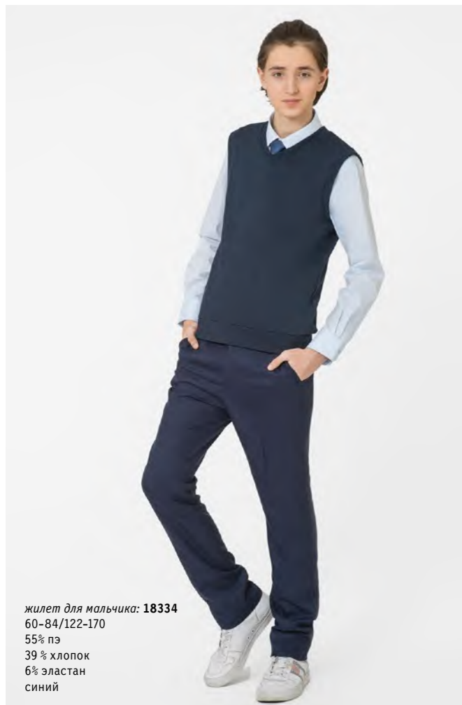
жилет для мальчика: 18334 60-84/122-170 55% пэ 39% хлопок 6% эластан синий