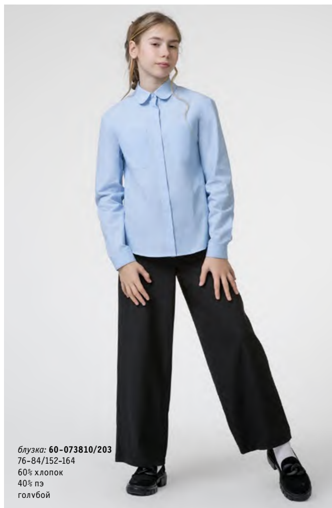
блузка: 60-073810/203 76-84/152-164 60% хлопок 40% пэ голлбой