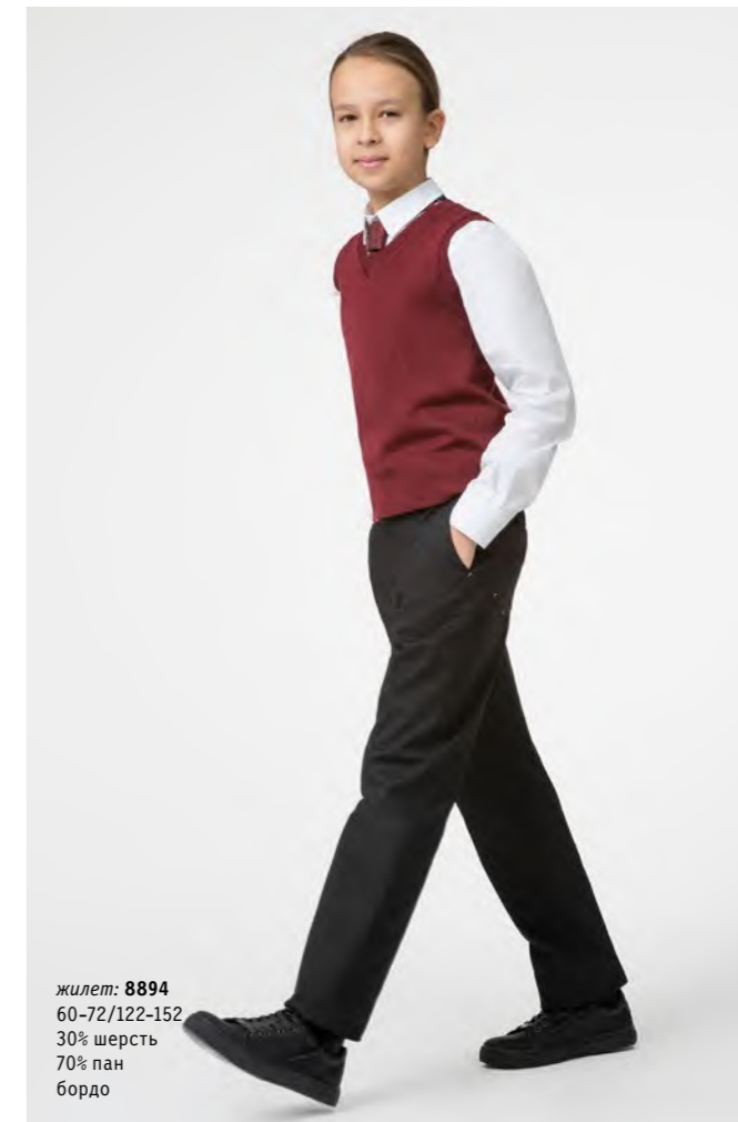
жилет: 8894 60-72/122-152 30% шерсть 70% пан бордо