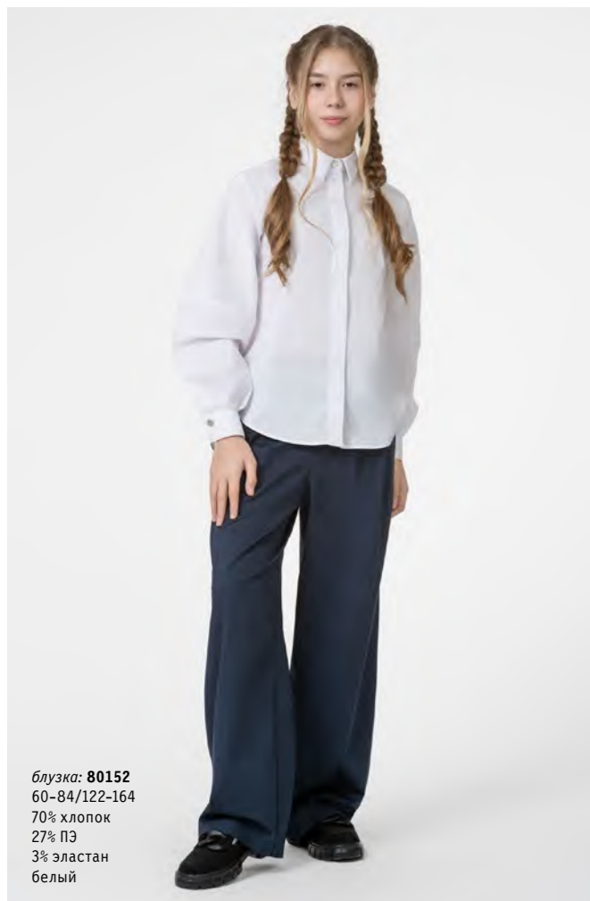
блузка: 80152 60-84/122-164 70% хлопок 27% пэ 3% эластан белый