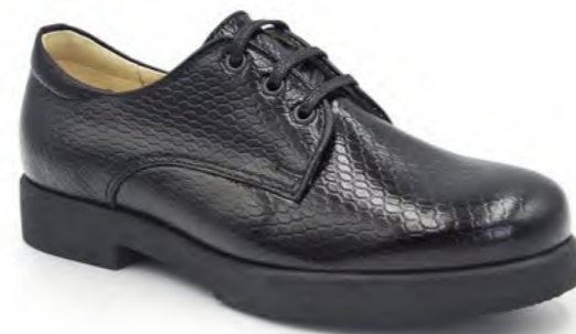
полуботинки для школьников: 64876 32-35 натуральная кожа натуральная кожа + текстильный материал тэп