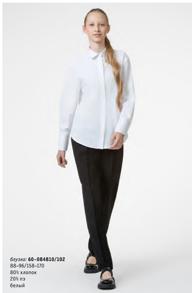
блузка: 60-084810/102 88-96/158-170 80% хлопок 20% пэ белый