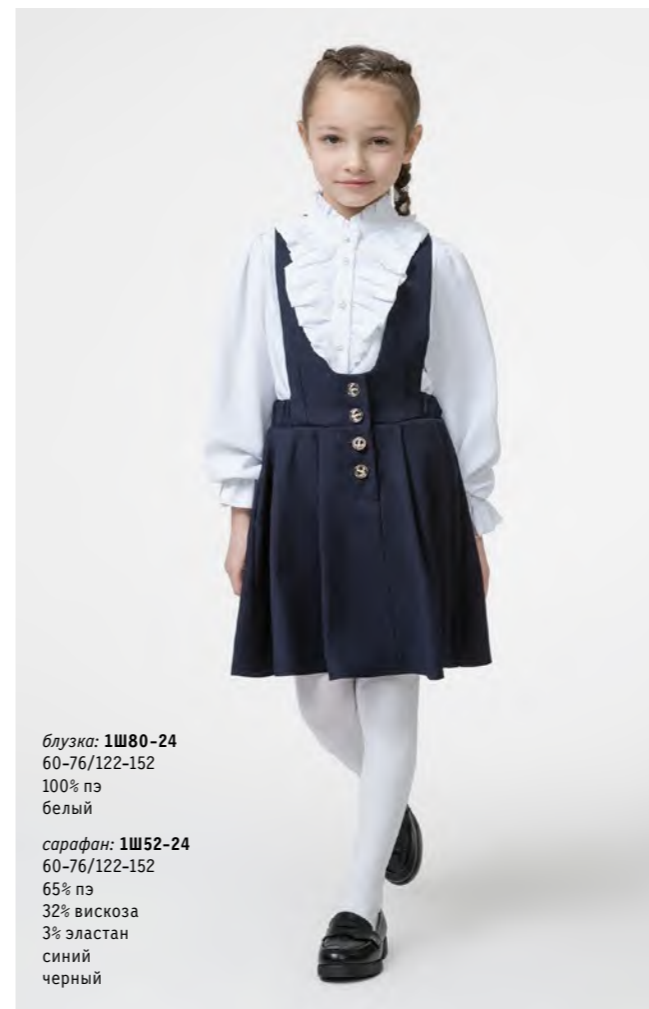
блузка: 1Ш80-24 60-76/122-152 100% пэ белый сарафан: 1Ш52-24 60-76/122-152 65% пэ 32% вискоза 3% эластан синий черный