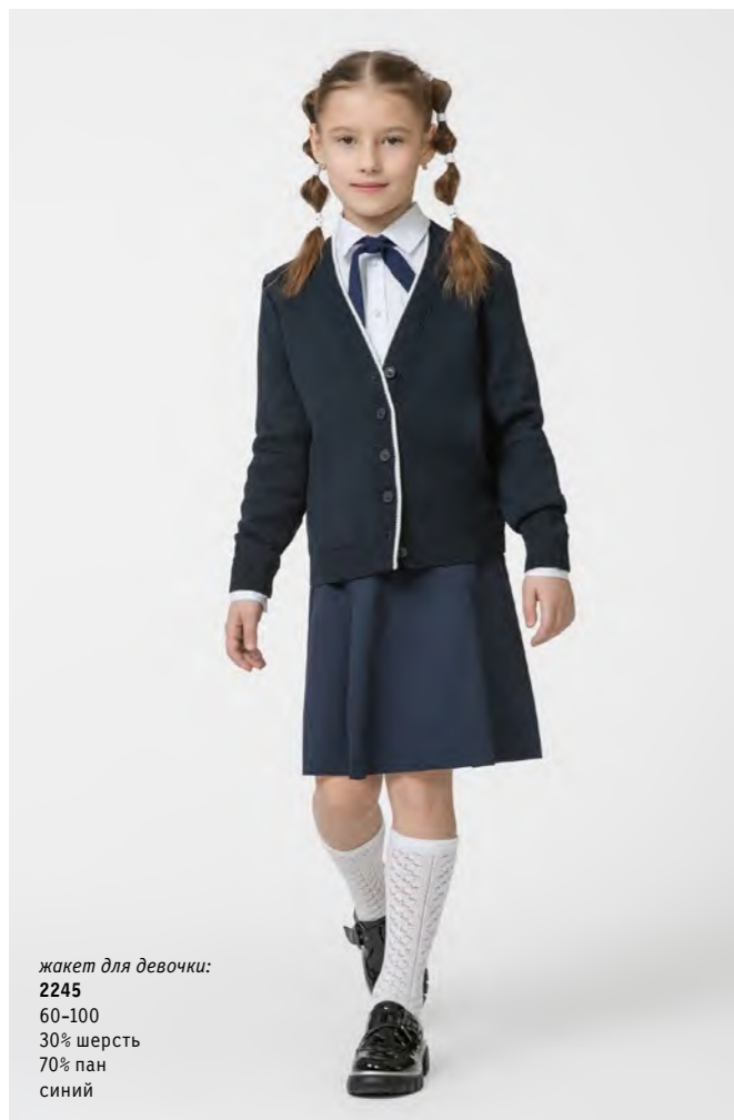
жакет для девочки: 2245 60-100 30% шерсть 70% пан синий