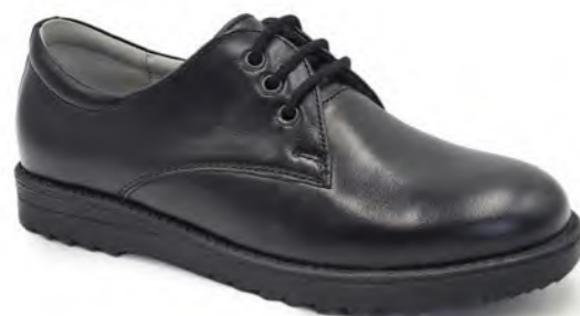
полуботинки для школьников-мальчиков: 64916 32-37 натуральная кожа натуральная кожа тэп