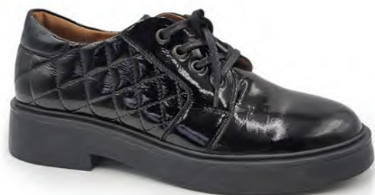
полуботинки для школьников-мальчиков: 64600 33-36 натуральная кожа натуральная кожа тэп