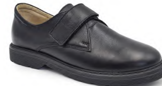
полуботинки девочки: 64/74934 36-41 натуральная кожа натуральная кожа тэп