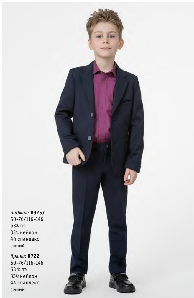
пиджак: R9257 60-76/116-146 63% пэ 33% нейлон 4% спандекс синий брюки: R722 60-76/116-146 63% пэ 33% нейлон 4% спандекс синий