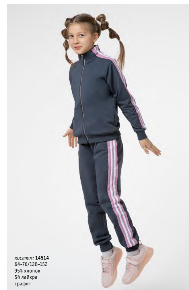
костюм: 14514 64-76/128-152 95% хлопок 5% лайкра графит