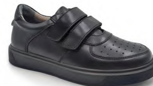
полуботинки для школьников-мальчиков: 64/74816 32-41 натуральная кожа натуральная кожа тэп