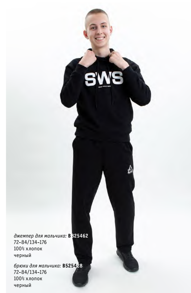
джерсер для мальчика: B325462 72-84/134-176 100% хлопок черный брюки для мальчика: B525428 72-84/134-176 100% хлопок черный