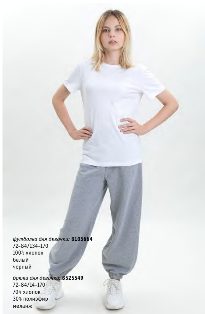
футболка для девочки: B105664 72-84/134-170 100% хлопок белый черный брюки для девочки: B525549 72-84/14-170 70% хлопок 30% полиэфир меланж