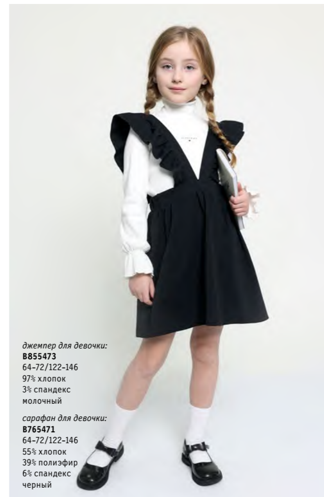
джерсер для дівочки: В855473 64-72/122-146 97% хлопок 3% спандекс молочный