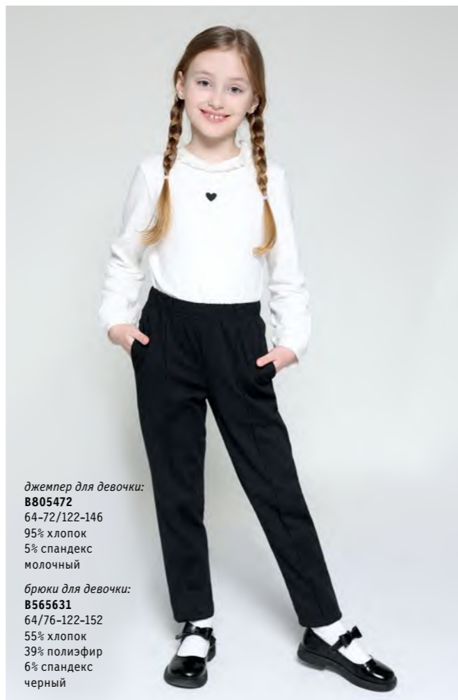
джерсер для дівочки: В805472 64-72/122-146 95% хлопок 5% спандекс молочный