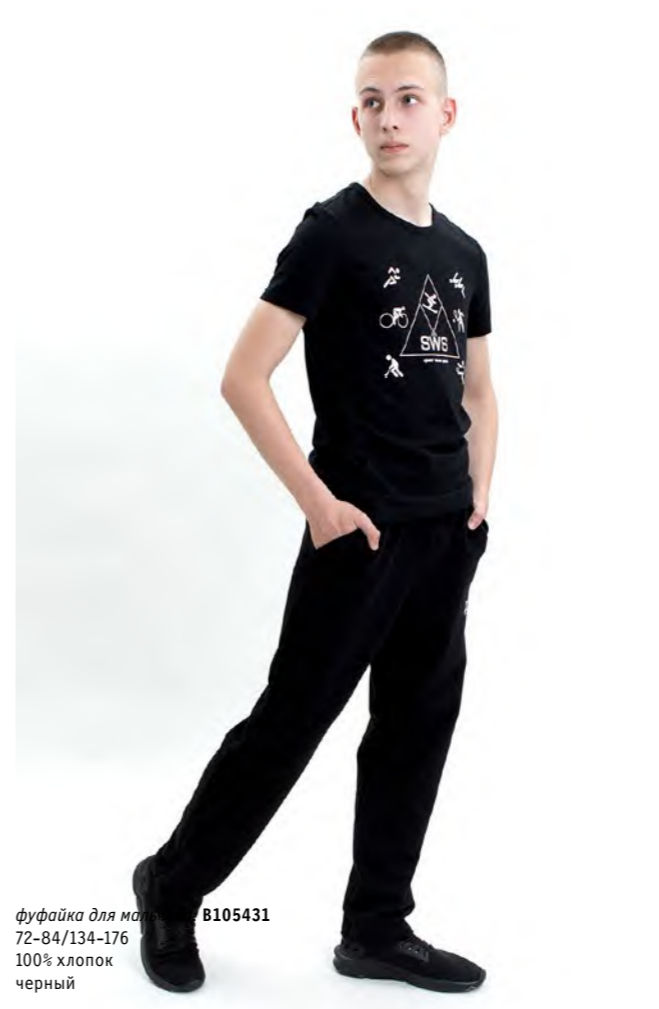
фудфайка для мальчика: B105431 72-84/134-176 100% хлопок черный