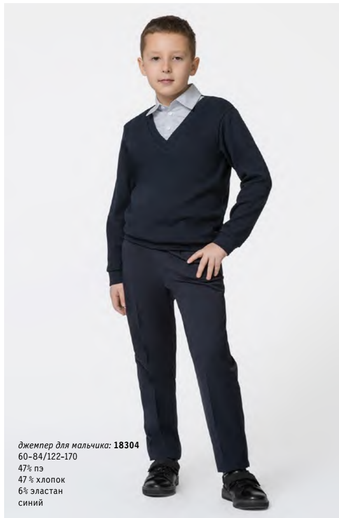
джерпер для мальчика: 18304 60-84/122-170 47% пэ 47% хлопок 6% эластан синий