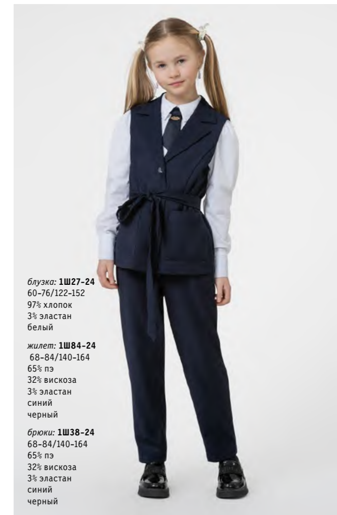
блузка: 1Ш27-24 60-76/122-152 97% хлопок 3% эластан белый жилет: 1Ш84-24 68-84/140-164 65% пэ 32% вискоза 3% эластан синий черный брюки: 1Ш38-24 68-84/140-164 65% пэ 32% вискоза 3% эластан синий черный