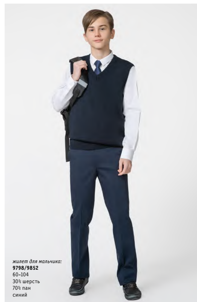
жилет для мальчика: 9798/9852 60-104 30% шерсть 70% пан синий

Ассортимент представлен однотонными жилетами и жилетами с полоской по горловине и низу изделия, а также жакетами с белой полосой. Модели выпускаются из полушерстяной пряжи в матросско-синем цвете.