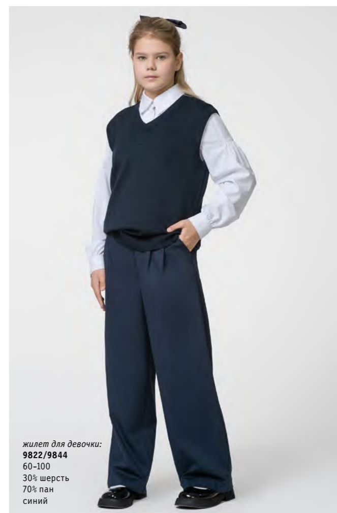
жилет для девочки: 9822/9844 60-100 30% шерсть 70% пан синий