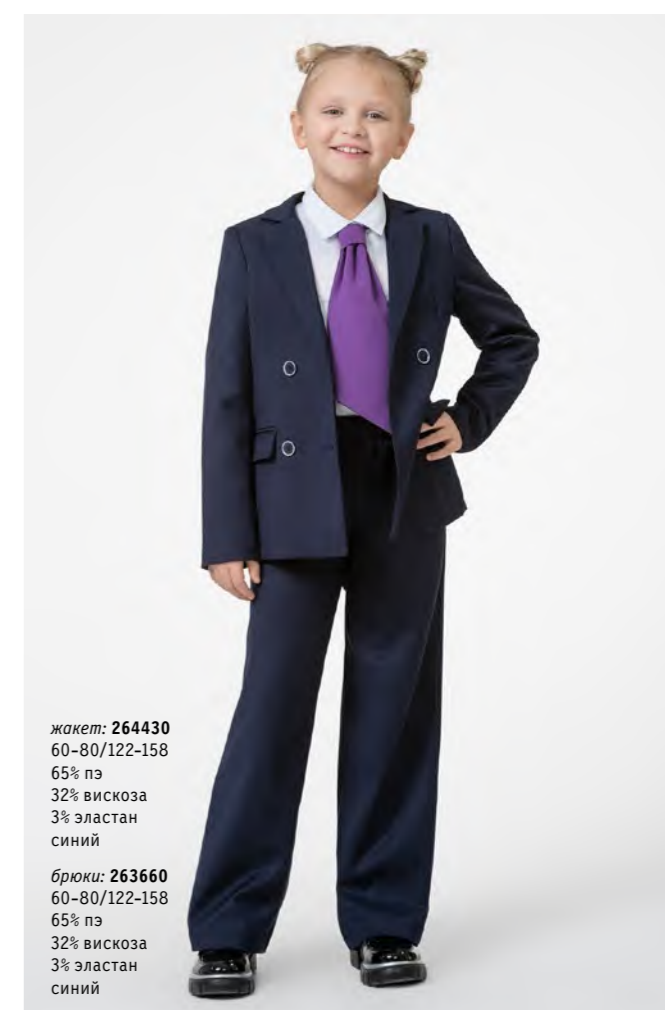
жакет: 264430 60-80/122-158 65% пэ 32% вискоза 3% эластан синий