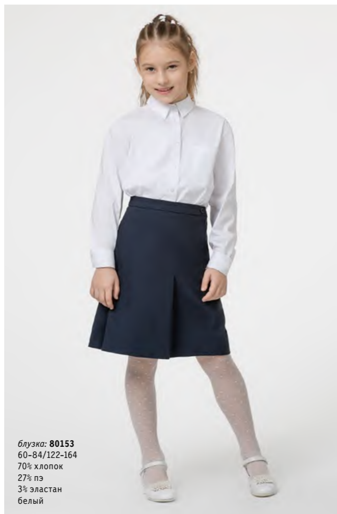
блузка: 80153 60-84/122-164 70% хлопок 27% пэ 3% эластан белый