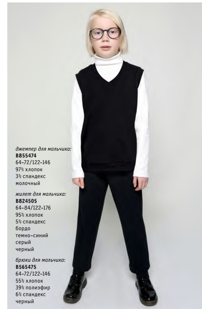
джерсер для мальчика: В855474 64-72/122-146 97% хлопок 3% спандекс молочный