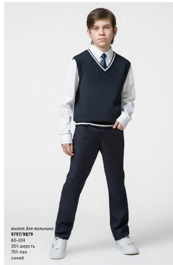
жилет для мальчика: 9797/9879 60-104 30% шерсть 70% пан синий