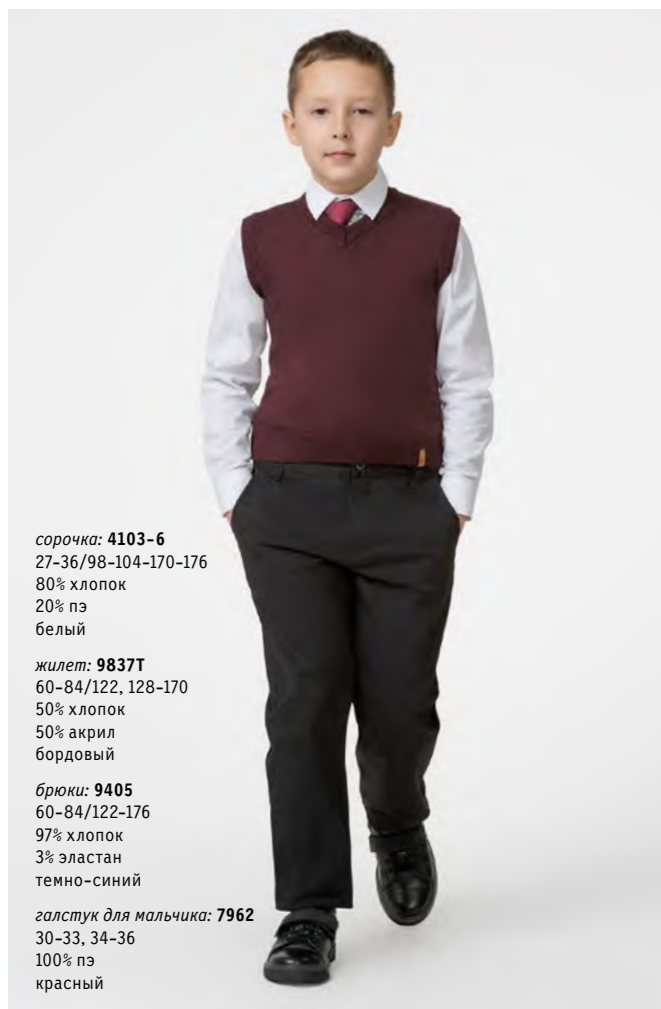
сорочка: 4103-6 27-36/98-104-170-176 80% хлопок 20% пэ белый