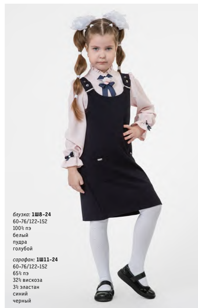
блузка: 1Ш8-24 60-76/122-152 100% пэ белый пудра голубой сарафан: 1Ш11-24 60-76/122-152 65% пэ 32% вискоза 3% эластан синий черный

С брендом TAMMI девочки выделяются стилем и элегантностью свойственным только истинным леди.