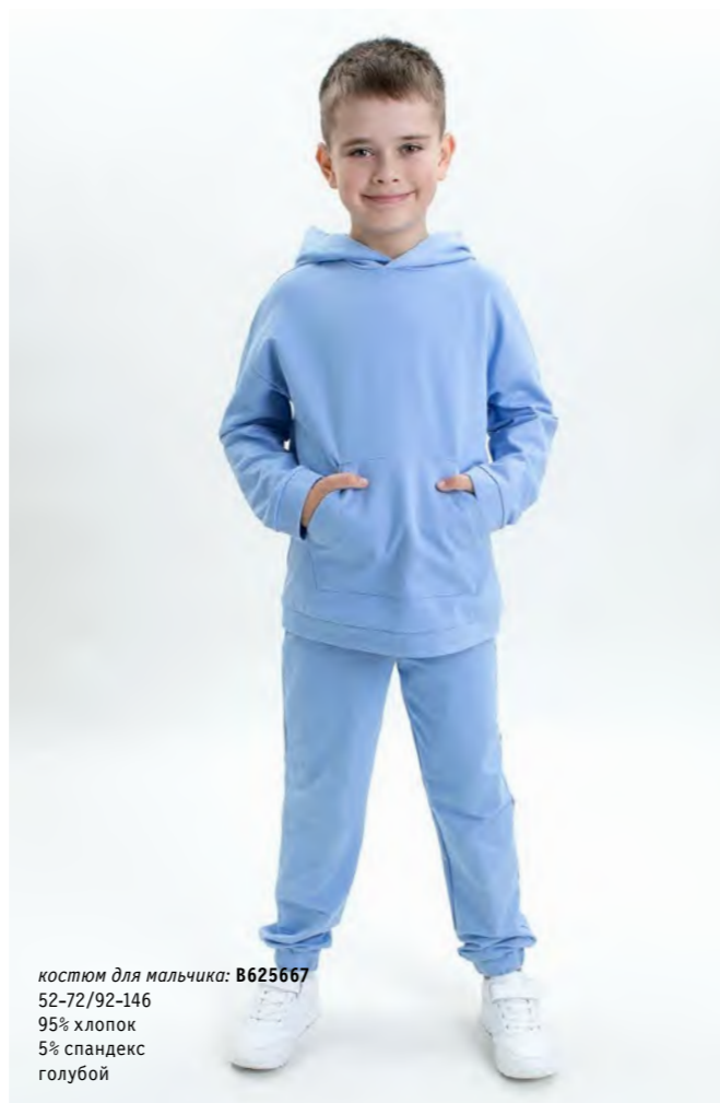
костюм для мальчика: B625667 52-72/92-146 95% хлопок 5% спандекс голубой