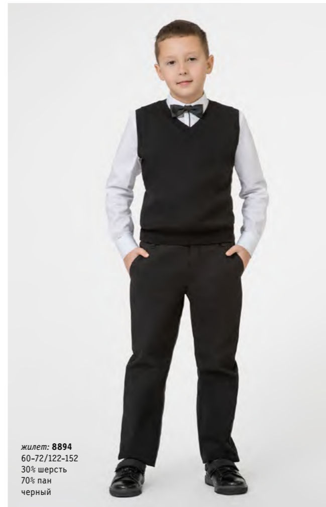
жилет: 8894 60-72/122-152 30% шерсть 70% пан черный

Все изделия выполнены из высококачественных натуральных материалов с добавлением шерсти, обеспечивая детям комфорт и свободу движения.