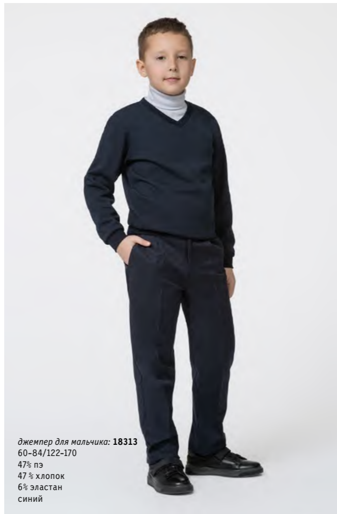
джерпер для мальчика: 18313 60-84/122-170 47% пэ 47% хлопок 6% эластан синий