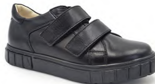
полуботинки для школьников-мальчиков: 64629 33-36 натуральная кожа натуральная кожа тэп