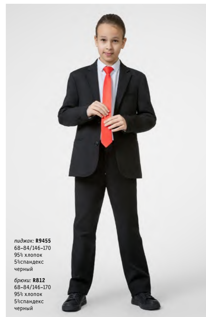
пиджак: R9455 68-84/146-170 95% хлопок 5% спандекс черный брюки: R812 68-84/146-170 95% хлопок 5% спандекс черный

COMINTERN – это одежда для тех, кто ценит лаконичность, стиль и практичность.