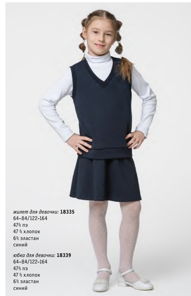
жилет для девочки: 18335 64-84/122-164 47% пэ 47% хлопок 6% эластан синий юбка для девочки: 18339 64-84/122-164 47% пэ 47% хлопок 6% эластан синий