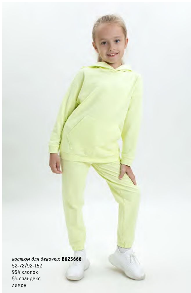
костюм для девочки: B625666 52-72/92-152 95% хлопок 5% спандекс лимон