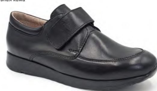
полуботинки для школьников-мальчиков: 64916 32-37 натуральная кожа натуральная кожа тэп