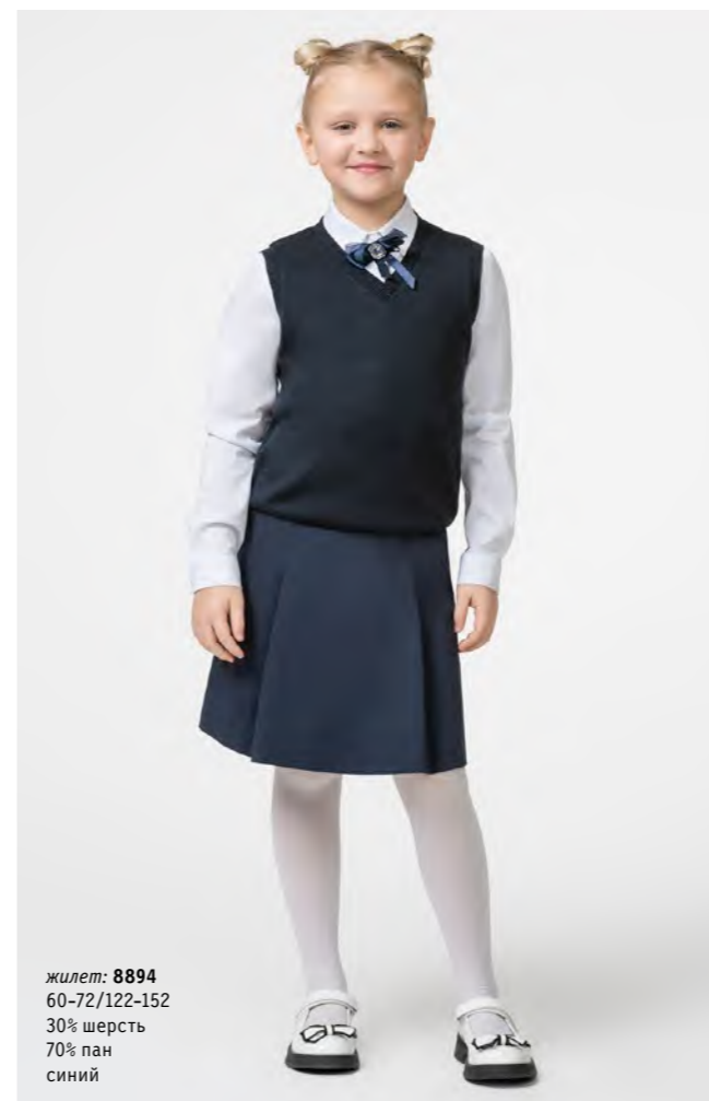
жилет: 8894 60-72/122-152 30% шерсть 70% пан синий