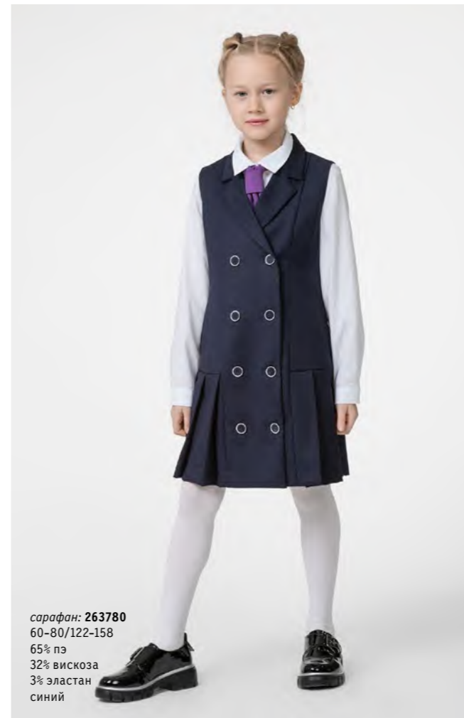
сарафан: 263780 60-80/122-158 65% пэ 32% вискоза 3% эластан синий