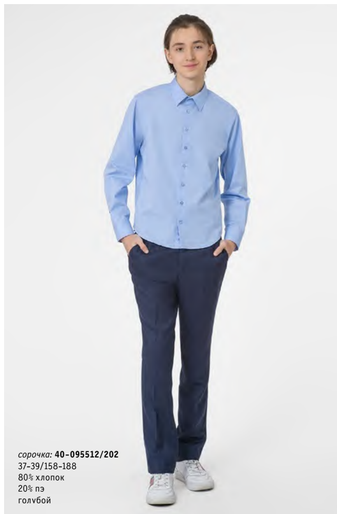
сорочка: 40-095512/202 37-39/158-188 80% хлопок 20% пэ голлбой