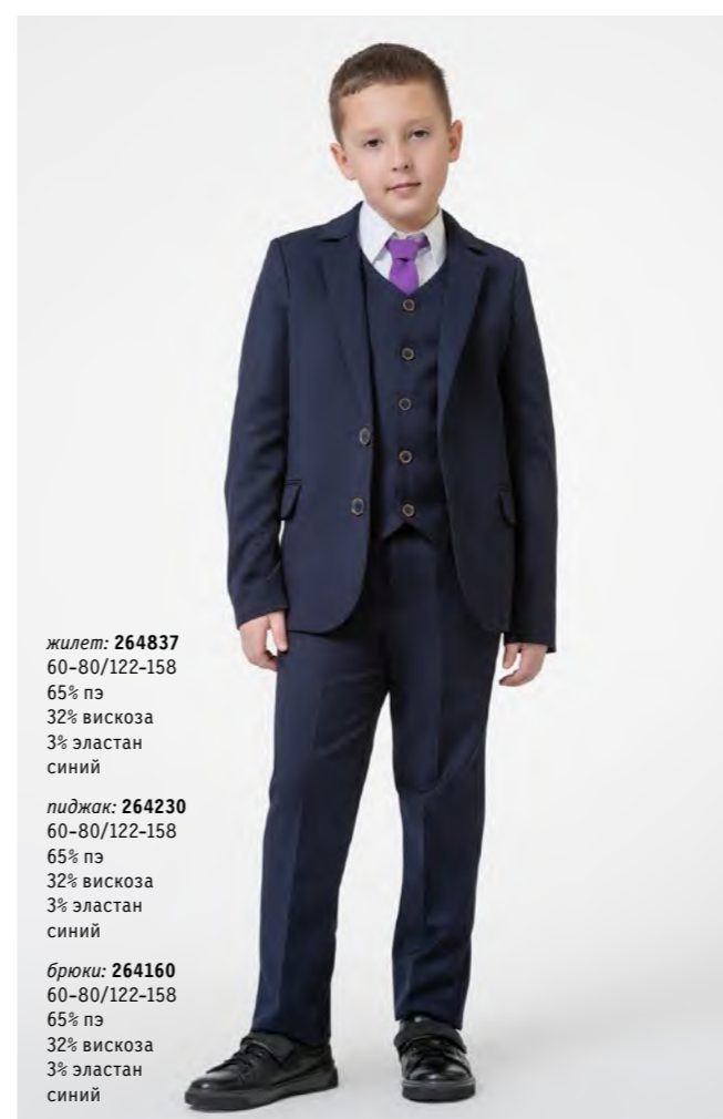
жилет: 264837 60-80/122-158 65% пэ 32% вискоза 3% эластан синий

Наша коллекция школьной формы – это не просто одежда, это возможность для каждого ученика выразить свою индивидуальность и чувствовать себя уверенно в школе. Мы стремимся предоставить нашим клиентам лучшее сочетание стиля, комфорта и качества.