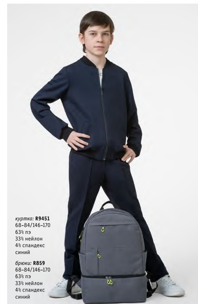
куртка: R9451 68-84/146-170 63% пэ 33% нейлон 4% спандекс синий брюки: R859 68-84/146-170 63% пэ 33% нейлон 4% спандекс синий