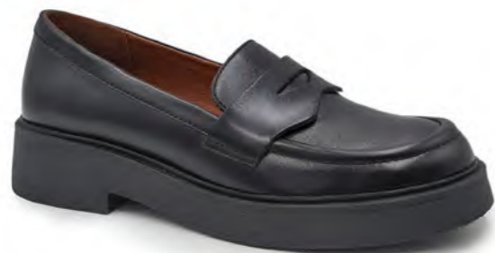
туфли для школьников-девочек: 64923 31-37 натуральная кожа натуральная кожа тэп