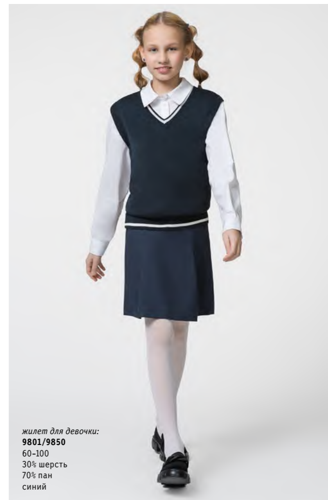
жилет для девочки: 9801/9850 60-100 30% шерсть 70% пан синий