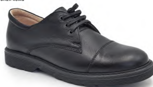
полуботинки для школьников: 64780 32-37 натуральная кожа натуральная кожа полиуретан