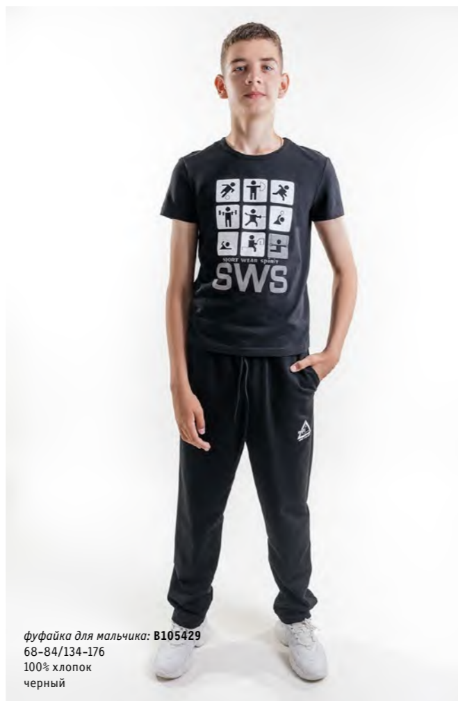
фудфайка для мальчика: B105429 68-84/134-176 100% хлопок черный