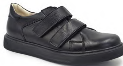
полуботинки для школьников-мальчиков: 65/75039 32-43 натуральная кожа натуральная кожа тэп