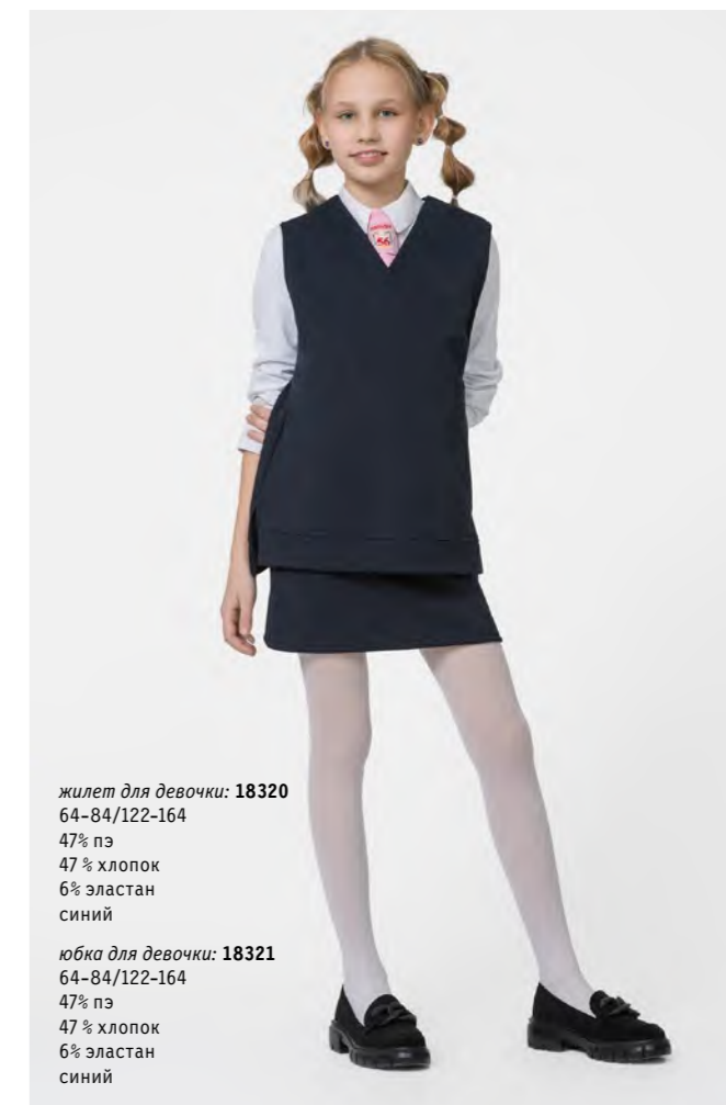
жилет для девочки: 18320 64-84/122-164 47% пэ 47% хлопок 6% эластан синий юбка для девочки: 18321 64-84/122-164 47% пэ 47% хлопок 6% эластан синий