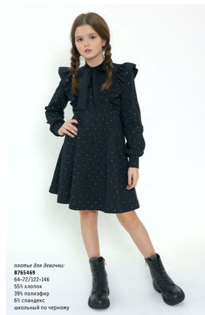
платье для дівочки: В765469 64-72/122-146 55% хлопок 39% поліэфир 6% спандекс школьный по черному

Благодаря хлопку полотно обладает гигиеничностью, хорошо пропускает воздух, а нити полиэфира и спандекса помогают долго сохранить свою первоначальную форму и насыщенность цвета.