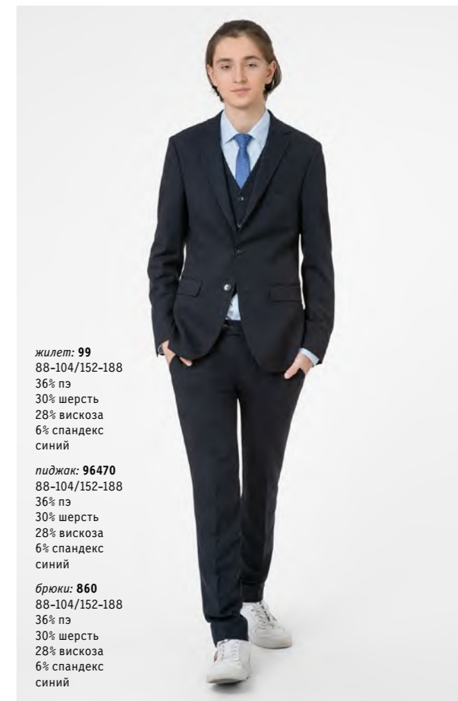
жилет: 99 88-104/152-188 36% пэ 30% шерсть 28% вискоза 6% спандекс синий пиджак: 96470 88-104/152-188 36% пэ 30% шерсть 28% вискоза 6% спандекс синий брюки: 860 88-104/152-188 36% пэ 30% шерсть 28% вискоза 6% спандекс синий