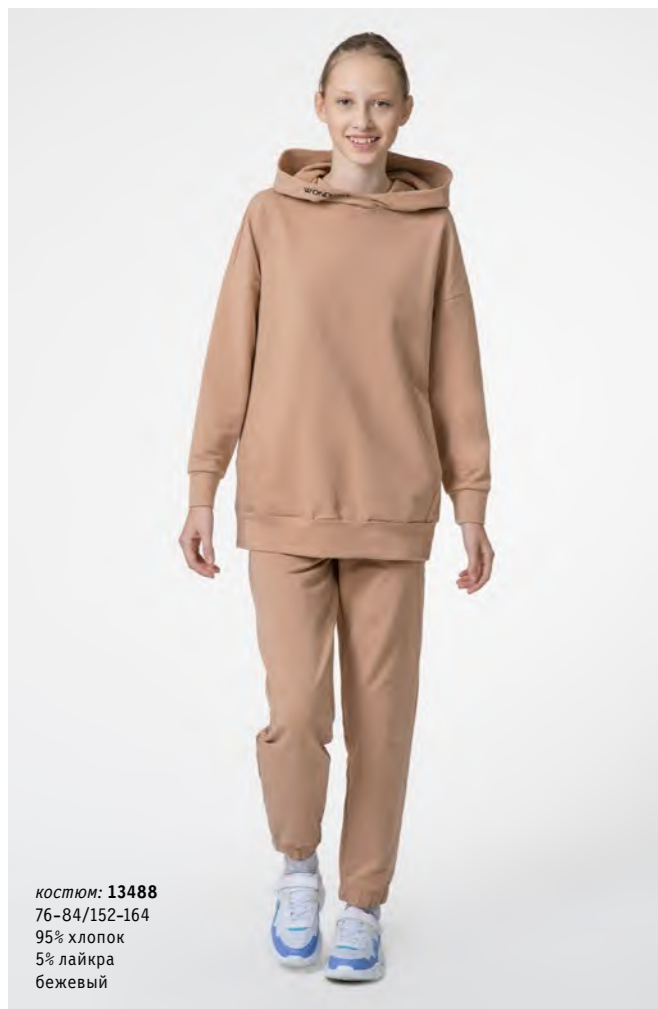
костюм: 13488 76-84/152-164 95% хлопок 5% лайкра бежевый