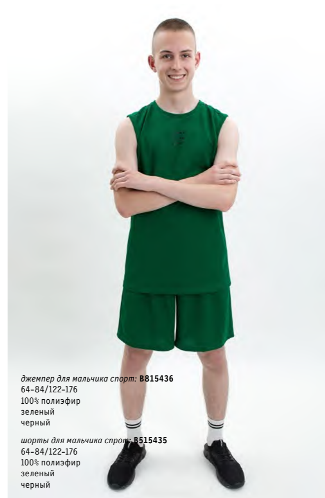
джерсер для мальчика спорт: B815436 64-84/122-176 100% полиэфир зеленый черный шорты для мальчика спорт: B515435 64-84/122-176 100% полиэфир зеленый черный