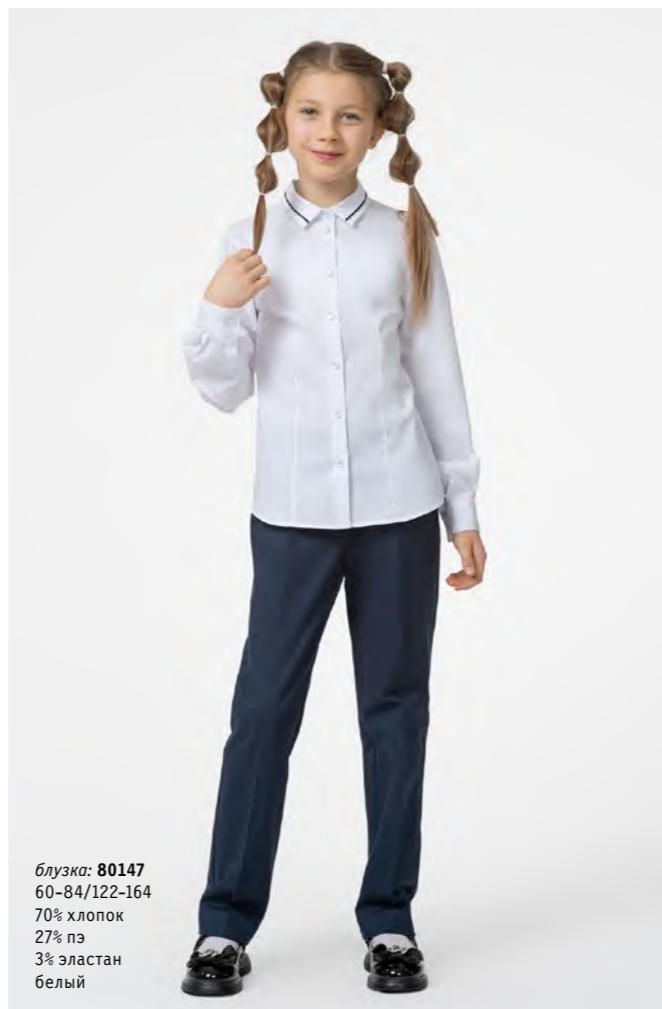
блузка: 80147 60-84/122-164 70% хлопок 27% пэ 3% эластан белый