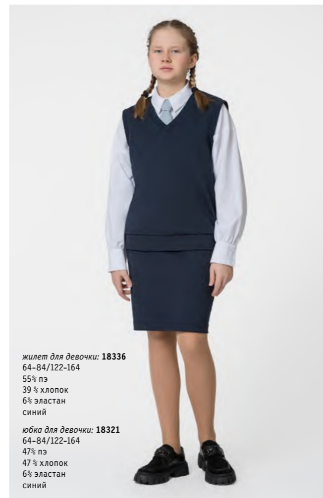
жилет для девочки: 18336 64-84/122-164 55% пэ 39% хлопок 6% эластан синий юбка для девочки: 18321 64-84/122-164 47% пэ 47% хлопок 6% эластан синий

В основе коллекции максимально удобные вещи без ярких акцентов и броских деталей, которые прекрасно дополняют школьный и повседневный гардероб ребенка.