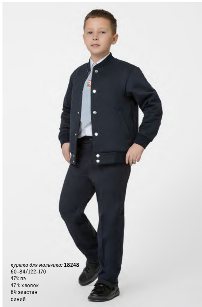
куртка для мальчика: 18248 60-84/122-170 47% пэ 47% хлопок 6% эластан синий