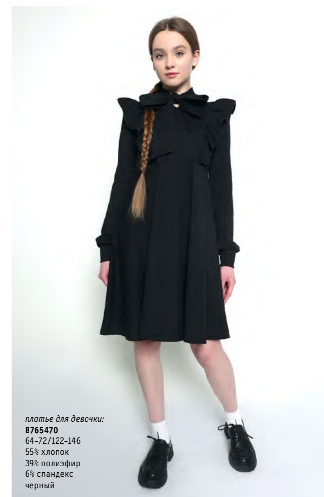
платье для дівочки: В765470 64-72/122-146 55% хлопок 39% поліэфир 6% спандекс черный