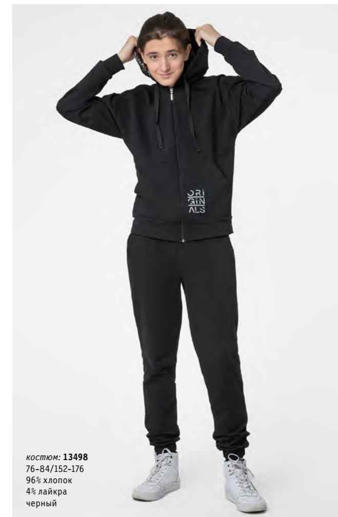
костюм: 13498 76-84/152-176 96% хлопок 4% лайкра черный