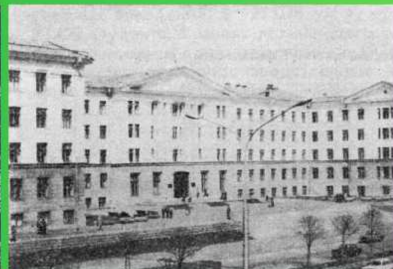
Белорусский институт механизации и электрификации сельского хозяйства в г.Минске