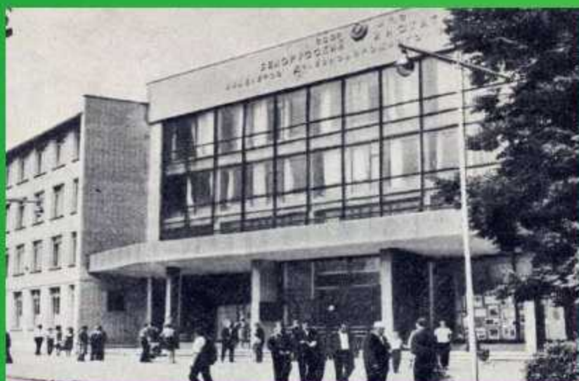
Белорусский институт инженеров железнодорожного транспорта в г.Гомеле