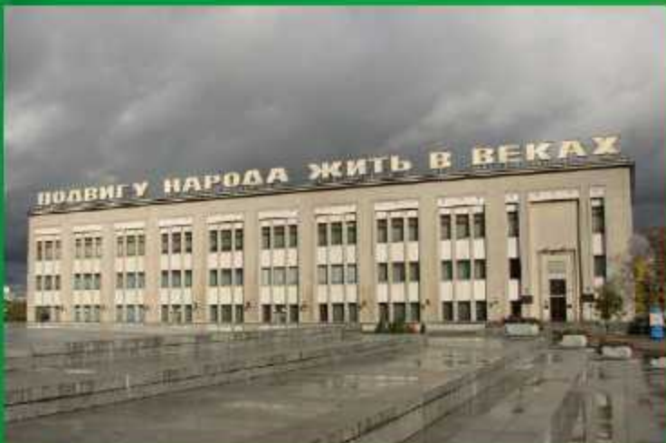
Белорусский государственный музей истории Великой Отечественной войны (старое здание)