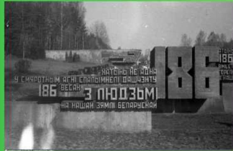
Мемориальный комплекс Хатынь