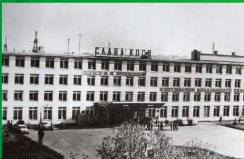
Гродненский сельскохозяйственный институт, вторая половина 1950-х

Быстро восстановились учреждения образования. В 1950/1951 учебном году количество школ в республике достигло довоенного уровня