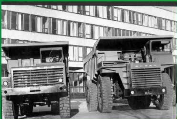
Белорусский автомобильный завод в г.Жодино