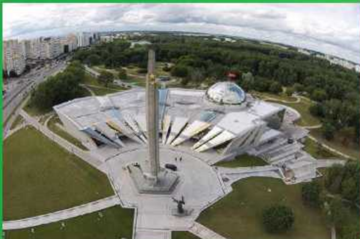
Белорусский государственный музей истории Великой Отечественной войны (новое здание)