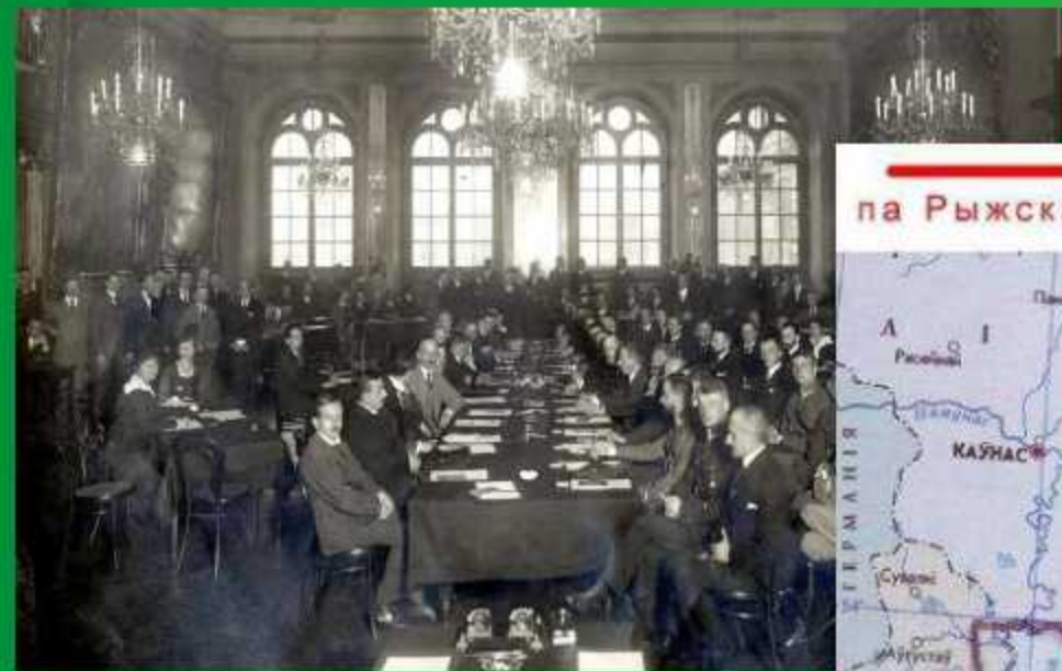
Рижский мирный договор 18 марта 1921 года