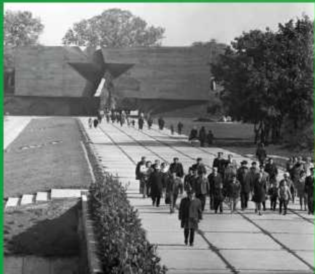
Мемориал Брестская крепость-герой