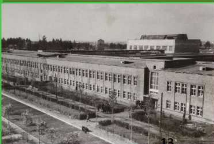
Солигорский калийный комбинат